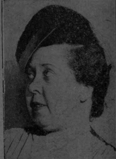
Srta. Minerva Bernardino

Es Minerva una enamorada de la causa feminista. Desde temprana edad ha luchado, sin tregua, por conseguir en su patria, la República Dominicana, los derechos para la mujer y ha visto coronada su obra. En febrero de 1943, aquella patria hermana, concedió a sus mujeres el sufragio y las cámaras abrieron sus puertas a las valerosas luchadoras dominicanas. El país está satisfecho de haber cumplido con un deber de justicia en este siglo llamado de la verdad democrática. Minerva Bernardino acaba de regresar a Washington, después de un interesante viaje cultural y cívico, por la isla de Cuba y al llegar de nuevo a su oficina de la Unión Panamericana, se le nombra Presidenta de la Comisión Interamericana de Mujeres. Los lazos de afecto, ideales y simpatía que desde hace tantos años nos ligan a ella, nos permiten sentir sus triunfos como si fuesen nuestros y esperar para el futuro, sorpresas y actividades. Nuevas y fecundas en esta gran causa por la completa emancipación de la mujer de América.