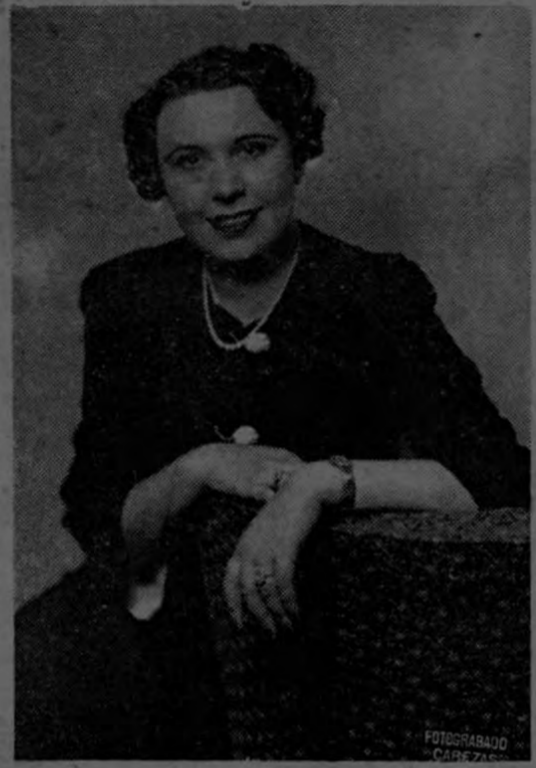
Presidenta del Capítulo Primero del Comité Auxiliar de Damas de la Cruz Roja