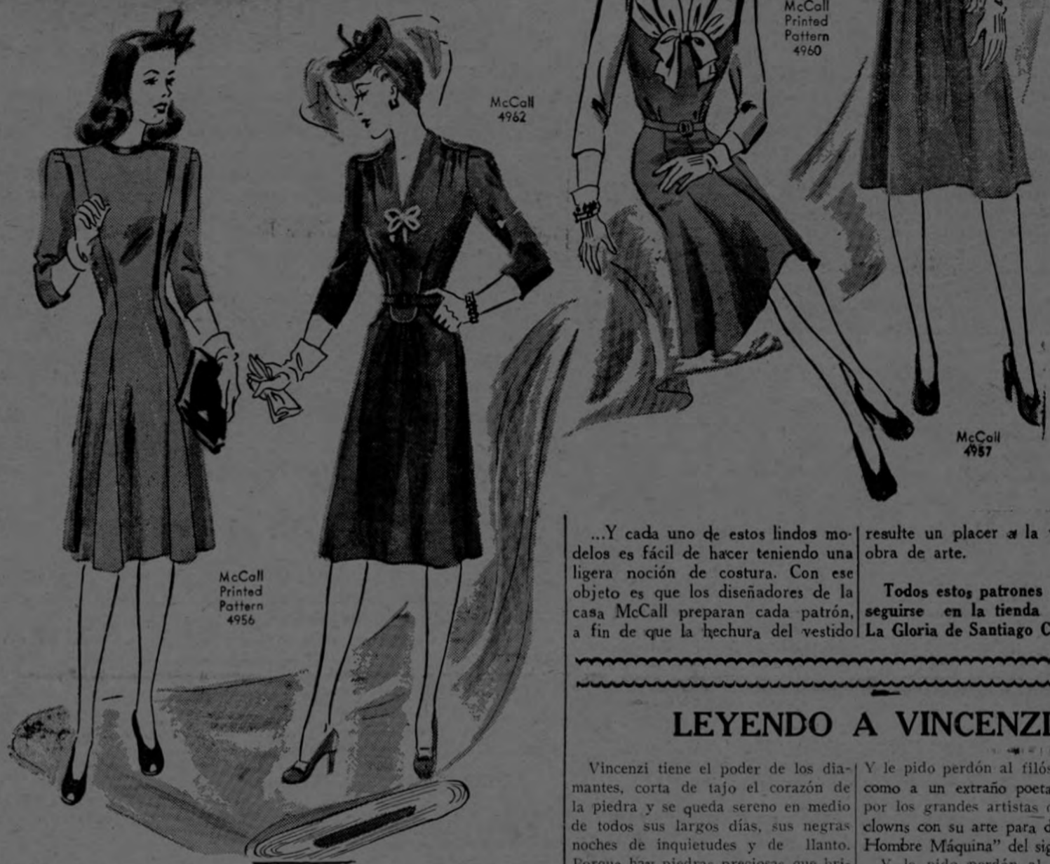
McCall Printed Pattern 4960