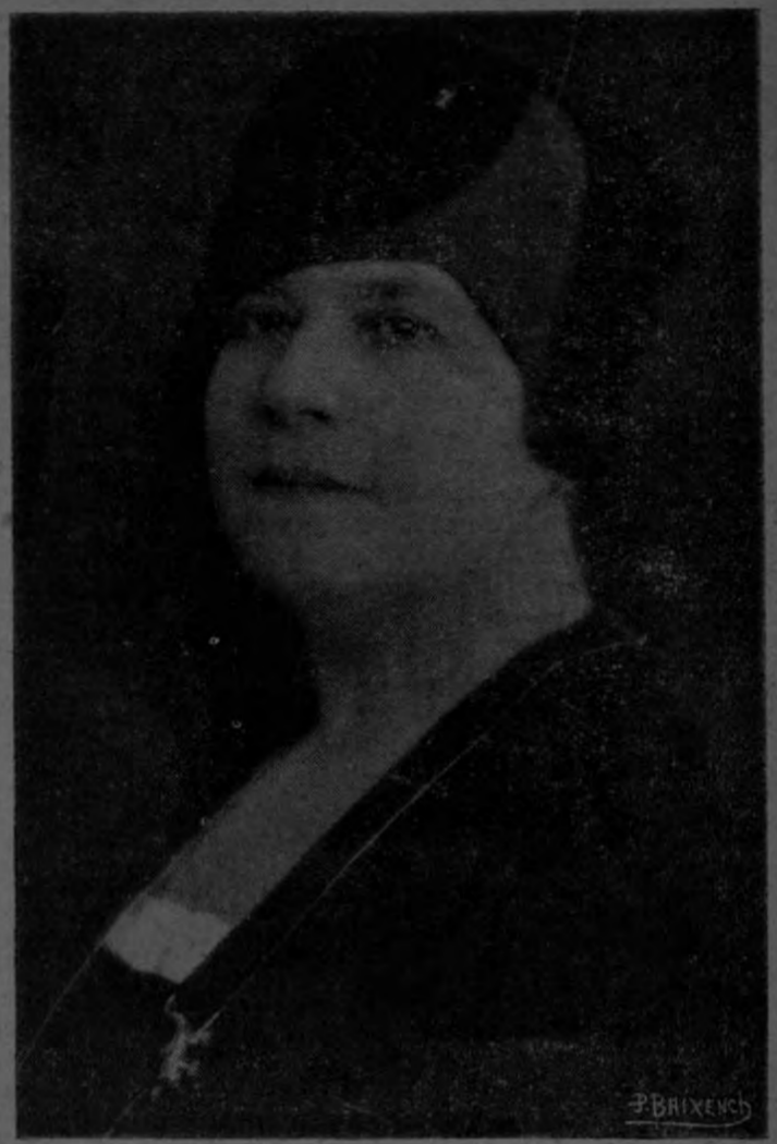
Vice-Presidenta del Capítulo Primero del Comité Auxiliar de Damas de la Cruz Roja